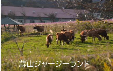
蒜山ジャージーランド

2023年 11月 3(金) 4(土) 5(日) 11(土) 12(日) 18(土) 19(日)